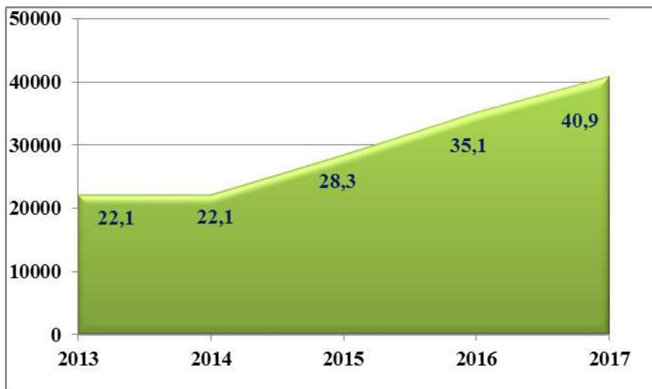
Объем инвестиций в основной капитал по Кабардино-Балкарской Республике за 2013 - 2017 годы, млрд рублей

В 2017 году по сравнению с 2016 годом доля привлеченных средств увеличилась на 1,3% и составила 75,6% от общего объема инвестиций.